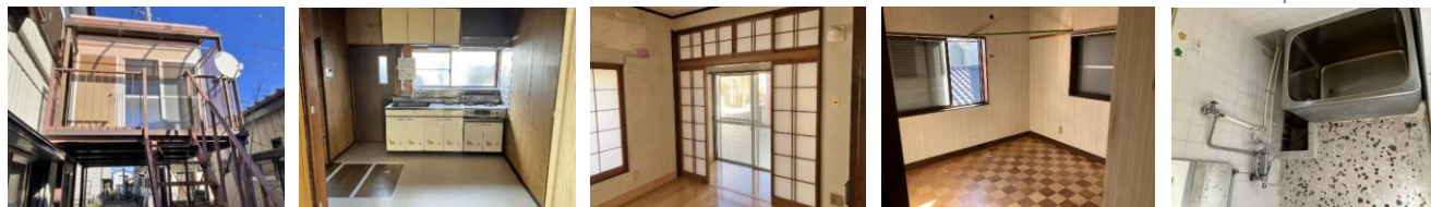
※図面と現況が異なる場合は現況を優先とします。