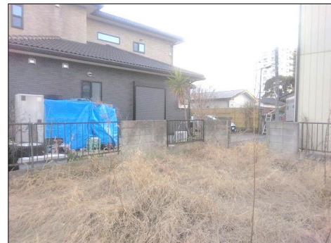
敷地内より道路側撮影