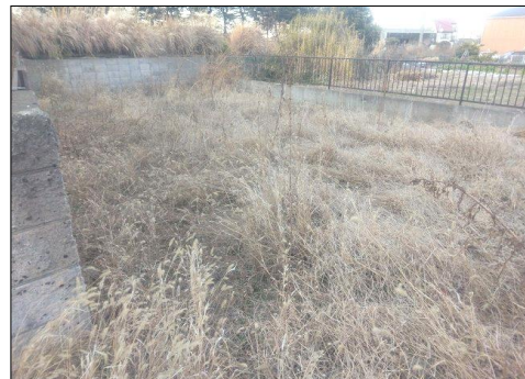
敷地入口より敷地内撮影