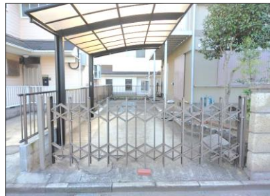
2台分の駐車スペース