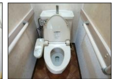
手摺のあるトイレ