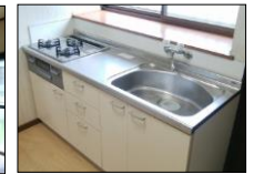
令和1年交換システムキッチン