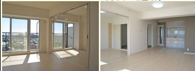
キッチン・和室方向